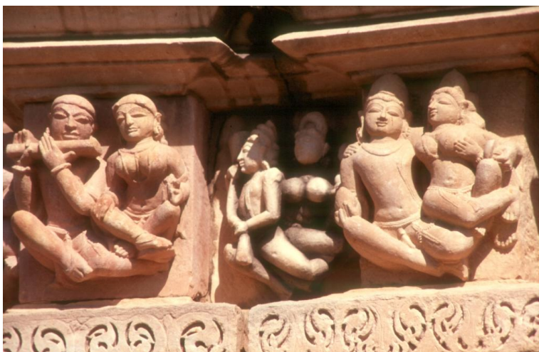
Gandharvas – himmlische Musikanten