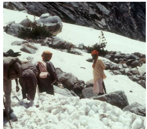
Pilger auf dem Weg zur Bhagirathi-Quelle im Himalaya