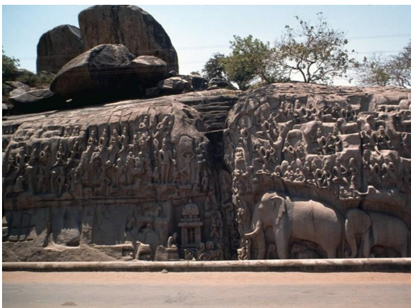
Der Mythos von der Herabkunft der Ganga als Felsrelief in Mahabalipuram, Tamil Nadu